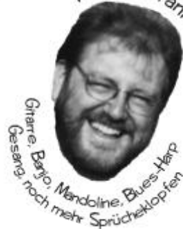
Gitarre, Baryo, Mandoline, Blues-Harp, Gesang, noch mehr Sprücheklopfen