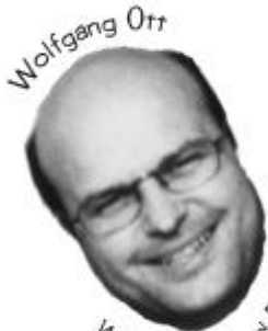
Waschbrett, Trommel, Esstisch, Gesang, Sprücheklopfen